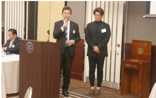
ガバナー杯 準優勝報告