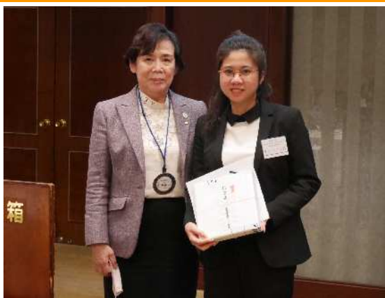
米山記念奨学生アンさん 最後の例会出席 受入期間(2021.4~2023.3)