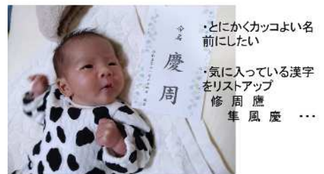
新米お父さん 連日頑張ってます！