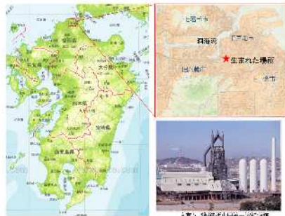
令和3年11月24日 長男 慶周 誕生