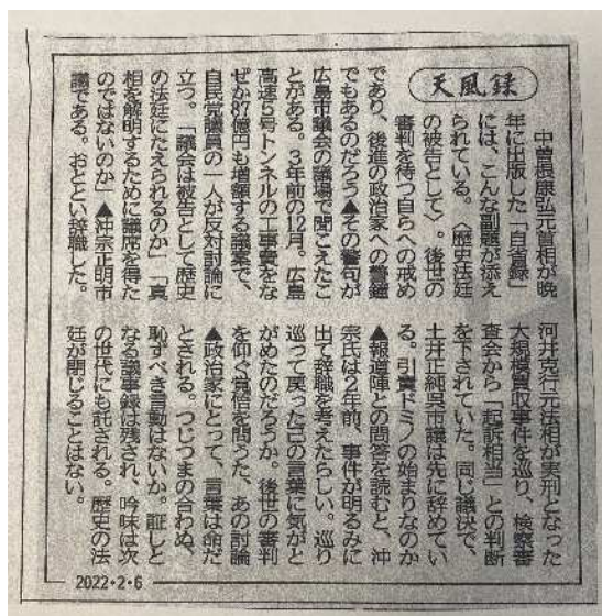
(2/6 中国新聞朝刊より)