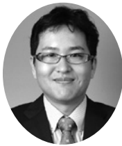
リーダー 河野 洋平