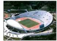
広島ビックアーチ