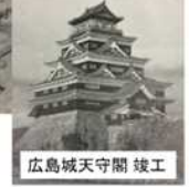
広島城天守閣 竣工