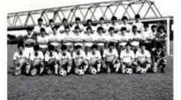
フジタ工業クラブサッカー部