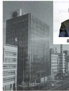
広島明治生命ビル