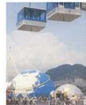
海と島の博覧会「フジタ館」