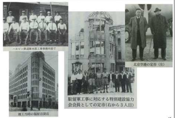
ハルビン鉄道線本工事現場用車で