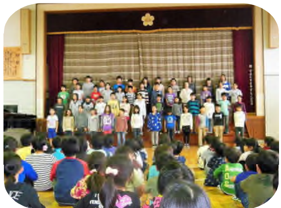
合唱で迎えてくれた館矢間小学校の皆さん 平成 26 年 10 月 23 日